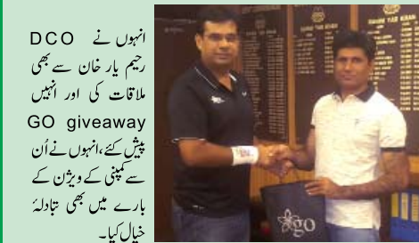
انہوں نے DCO رجیم یار خان سے بھی ملاقات کی اور انہیں GO giveaway پیش کئے، انہوں نے اُن سے بچوں کے ویڈیو کے بارے میں بھی تبادلہ خیال کیا۔