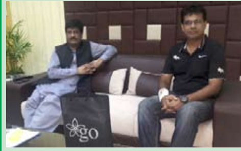
انہوں نے DCO ساہیوال کا بھی ستمبر 2018ء میں دورہ کیا اور GO برانڈ کے بارے میں مختصر پریزنٹیشن دی۔