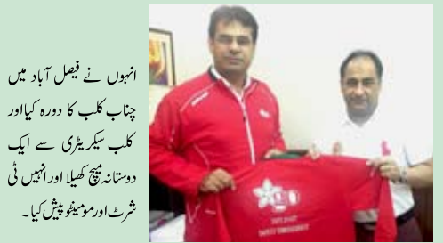
انہوں نے فیصل آباد میں چناب کلب کا دورہ کیا اور کلب سیکریٹری سے ایک دوستانہ میچ کھیلا اور انہیں ٹی شرٹ اور مونیٹو پیش کیا۔