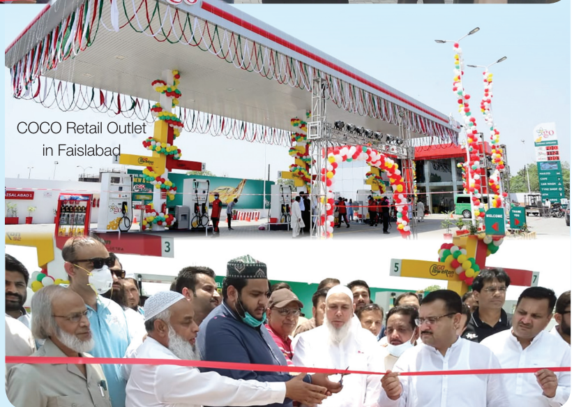
COCO Retail Outlet in Faisalabad