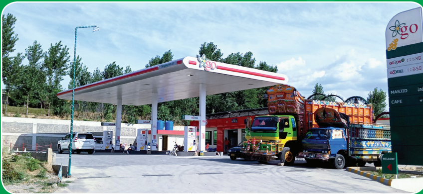
“GO's newly commissioned retail outlet at Main N-15, Naran-Kaghan Road, Jabba, Mansehra is now open for all providing quality fuel”.