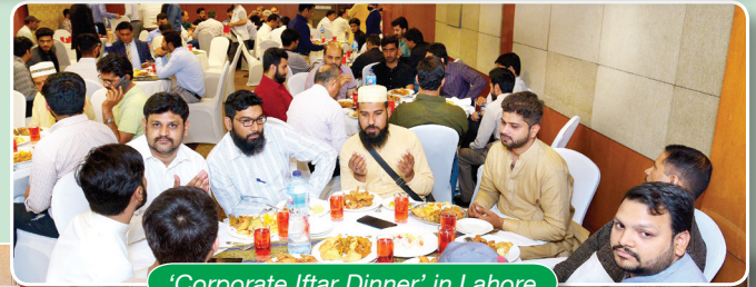
'Corporate Iftar Dinner' in Lahore

go organized a 'Corporate Iftar Dinner' for its employees in Lahore, Karachi and Sahiwal. The iftar dinner was well attended by all staff members at their respective locations. This provided an opportunity for all employees and GO management to interact with each other, away from the regular office environment.