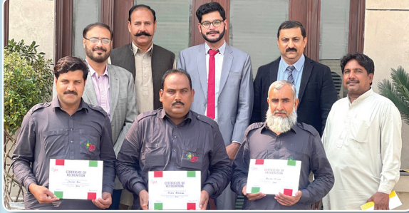
ڈرائیورز کے لیے اعترافی ایوارڈ برائے جنوری 2022