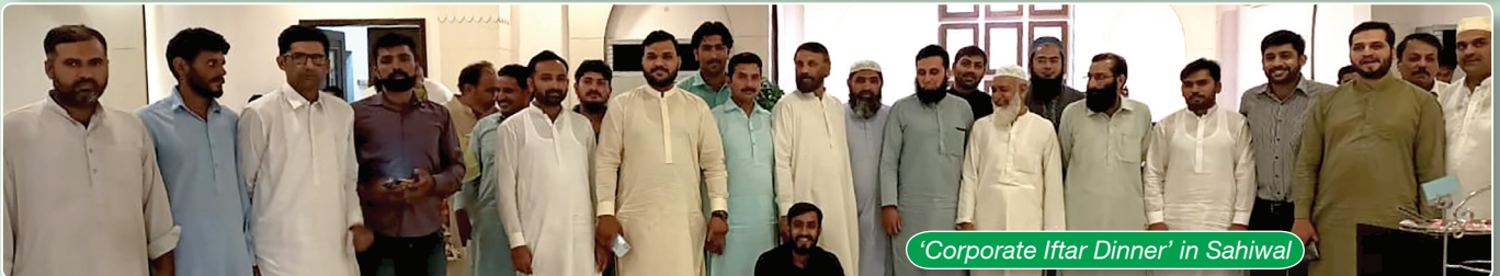
'Corporate Iftar Dinner' in Sahiwal