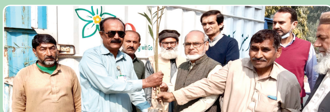
Commerce College Sahiwal