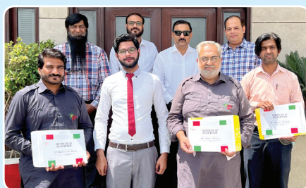
Drivers' Recognition Awards March, 2022