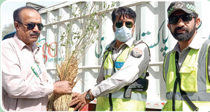
کے پی کے پولیس، چنچو، مکی مروت