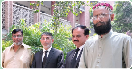
آفس آف دی سینئر سول جج، لاہور ڈویژن

جیسا کہ یہ ہمیشہ سے GO کا اصول رہا ہے اس بار پھر GO نرسری رینالہ خورد نے فروری 2022 سے اپریل 2022 تک ”سپرنگ ٹری پلانٹیشن سیزن“ کے دوران شجرکاری مہم میں بھرپور حصہ لیا۔ مہم کے دوران 140,000 پودے (چھاؤں دار درخت، پھل دار درخت اور پھول دار درخت) ملک بھر میں مختلف اداروں میں تقسیم کئے گئے۔ GO نرسری کی زیادہ پودے اور درخت اگانے کی صلاحیت میں اضافہ کے لیے کوششیں جاری ہیں تاکہ آنے والے دونوں میں پاکستان کو مزید سبز اور خوبصورت بنایا جاسکے۔ مہم کے دوران GO کی طرف سے فلیگ شپ ٹری پلانٹنگ اور جنگلات اگانے کا پروگرام شروع کیا گیا اور مختلف تعلیمی اداروں، حکومت اور فوجی مقامات میں بڑی تعداد میں پودے عطیہ کئے گئے جیسا کہ ذیل میں دکھایا گیا ہے۔