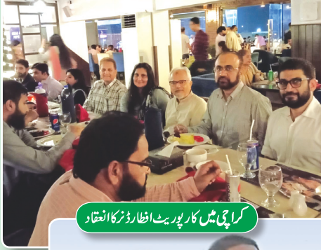
کراچی میں کارپوریٹ افطار ڈنر کا انعقاد