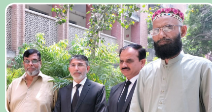
Office of the Senior Civil Judge, Lahore Division