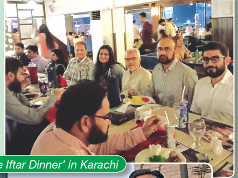
'Corporate Iftar Dinner' in Karachi