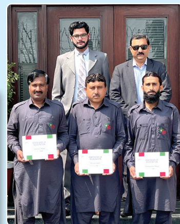
Drivers' Recognition Awards February, 2022