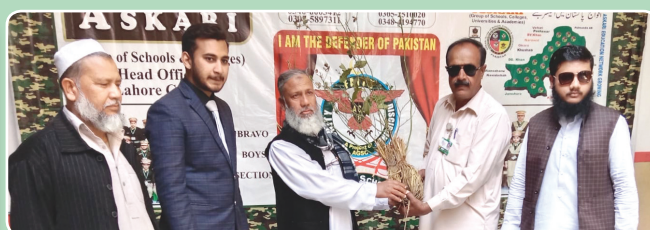
Askari School Sadhoki, Gujranwala