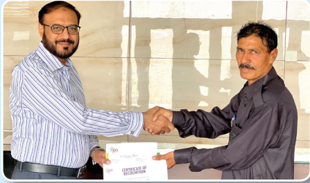
ڈرائیورز کے لیے اعترافی ایوارڈ برائے مارچ 2022