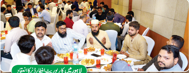
لاہور میں کارپوریٹ افطار ڈنر کا انعقاد

GO نے لاہور، کراچی اور ساہیوال میں اپنے ملازمین کے لیے کارپوریٹ افطار ڈنر کا اہتمام کیا۔ تمام اسٹاف اراکین نے اپنے متعلقہ مقامات پر افطار ڈنر میں شرکت کی۔ افطار ڈنر سے تمام ملازمین اور GO انتظامیہ کو دفتری ماحول سے نکل کر ایک دوسرے کے ساتھ میل جول کا موقع ملا۔