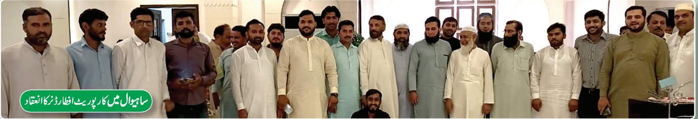
ساہیوال میں کارپوریٹ افطار ڈنر کا انعقاد