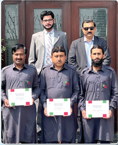
ڈرائیورز کے لیے اعترافی ایوارڈ برائے فروری 2022