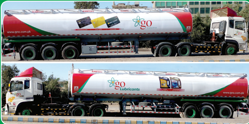
GO, has developed new tank truck design which will be implemented in a phased manner.