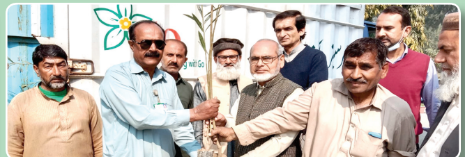
کامرس کالج ساہیوال