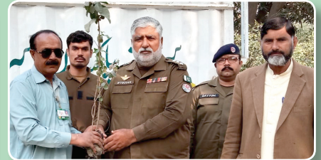
ڈی ایس پی آفس ساہیوال