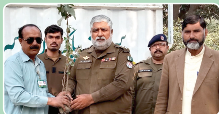
DSP Office Sahiwal