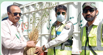
KPK Police, Peju, Lakki Marwat