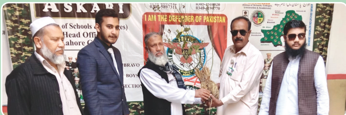
عسکری اسکول سادھوکی، گوبرانولہ