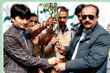
Divisional Public School, College Renala Khurd

As has been the norm at GO, this time again 'GO Nursery Renala Khurd' actively participated in the tree plantation drive during the 'Spring Tree Plantation Season' from February 2022 to April 2022. During the drive, a total of 140,000 saplings of various plants (e.g. shady trees, fruit trees and floral plants) were prepared and distributed amongst various setups across the country. Efforts are being made to further enhance the capacity of GO Nursery to grow more plants and trees for making Pakistan further green and beautiful in the days to come. Under the drive, a flagship tree-planting and afforestation programme initiated by GO and a large number of saplings were donated to various educational institutions, government and military setups, as shown in the following: