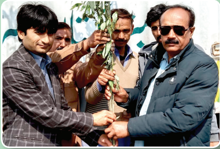
ڈویژنل پبلک سکول، کالج رینالہ خورد

جیسا کہ یہ ہمیشہ سے GO کا اصول رہا ہے اس بار پھر GO نرسری رینالہ خورد نے فروری 2022 سے اپریل 2022 تک ”سپرنگ ٹری پلانٹیشن سیزن“ کے دوران شجرکاری مہم میں بھرپور حصہ لیا۔ مہم کے دوران 140,000 پودے (چھاؤں دار درخت، پھل دار درخت اور پھول دار درخت) ملک بھر میں مختلف اداروں میں تقسیم کئے گئے۔ GO نرسری کی زیادہ پودے اور درخت اگانے کی صلاحیت میں اضافہ کے لیے کوششیں جاری ہیں تاکہ آنے والے دونوں میں پاکستان کو مزید سبز اور خوبصورت بنایا جاسکے۔ مہم کے دوران GO کی طرف سے فلیگ شپ ٹری پلانٹنگ اور جنگلات اگانے کا پروگرام شروع کیا گیا اور مختلف تعلیمی اداروں، حکومت اور فوجی مقامات میں بڑی تعداد میں پودے عطیہ کئے گئے جیسا کہ ذیل میں دکھایا گیا ہے۔