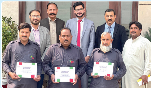
Drivers' Recognition Awards January, 2022