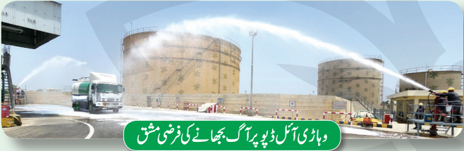
دہاڑی آئل ڈپو پر آگ بجھانے کی فرضی مشق

ساہیوال اور دہاڑی ڈپو میں سیفٹی ٹریننگ سیشنز کا انعقاد کیا گیا جن میں متعلقہ مقامات کی آپریشنز، لاجسٹکس، کیو اے اور سیورٹی ٹیموں نے شرکت کی۔ ساہیوال ڈپو میں مندرجہ ذیل پر تربیت دی گئی: 1۔ ٹی ایل (ایس او پی) کی فلنگ سے قبل ہاٹ ورک کے ٹھنڈے ہونے کا وقت