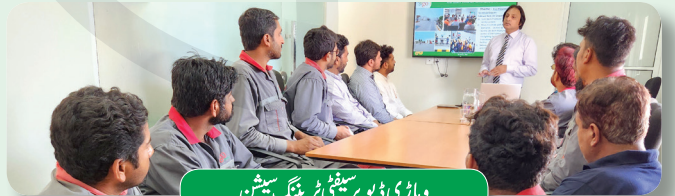
دہاڑی ڈپو پر سیفٹی ٹریننگ سیشن