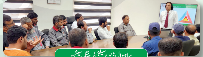
ساہیوال ڈپو پر سیفٹی ٹریننگ سیشن

ساہیوال اور دہاڑی ڈپو میں سیفٹی ٹریننگ سیشنز کا انعقاد کیا گیا جن میں متعلقہ مقامات کی آپریشنز، لاجسٹکس، کیو اے اور سیورٹی ٹیموں نے شرکت کی۔ ساہیوال ڈپو میں مندرجہ ذیل پر تربیت دی گئی: 1۔ ٹی ایل (ایس او پی) کی فلنگ سے قبل ہاٹ ورک کے ٹھنڈے ہونے کا وقت