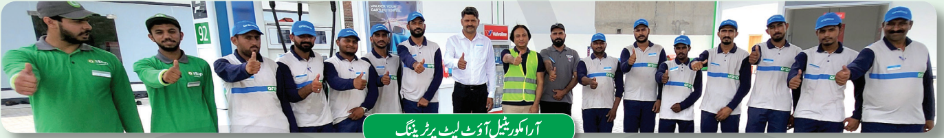
آراکو ریٹیل آؤٹ لیٹ پر ٹریننگ