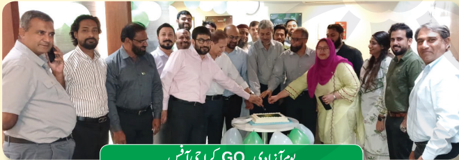
یوم آزادی - GO کراچی آفس