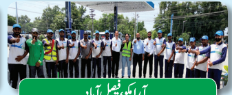
آراکو، فیصل آباد