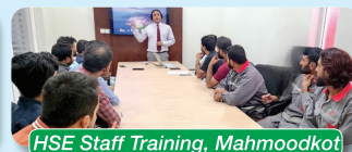
HSE Staff Training, Mahmoodkot