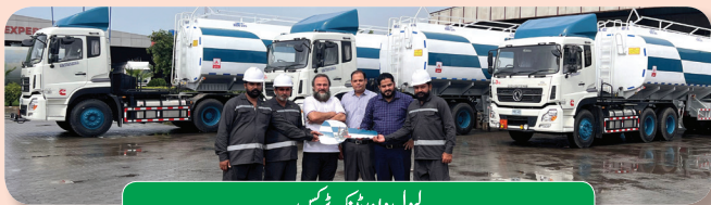
لیول ون ٹینک ٹرس

اگر اے کے نئے قواعد و ضوابط کے مطابق ٹینک ٹرس کی شمولیت کیلئے ان کے اہم کردار کیلئے دل سے شکریہ ادا کرتا ہے۔ اس سنگ میل کے حصول میں ان کا تعاون موثر ثابت ہوا۔