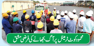
محمود کوٹ ٹرینل پراگ بھانے کی فرضی مشق