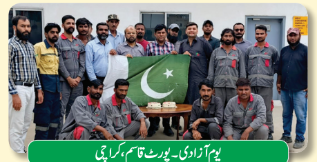
یوم آزادی - پورٹ قاسم، کراچی