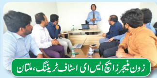
زون نیچرز ایچ ایس ای اسٹاف ٹریننگ، ملتان