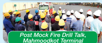
Post Mock Fire Drill Talk, Mahmoodkot Terminal