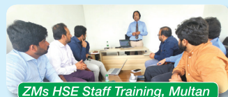
ZMs HSE Staff Training, Multan