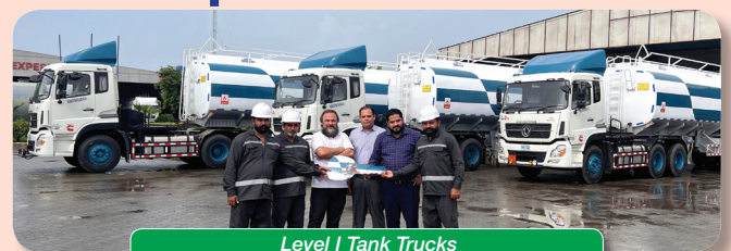
Level I Tank Trucks

GO extend their sincere gratitude to valued haulers Sitara