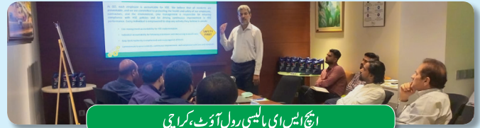
ایچ ایس ای پالیسی رول آؤٹ، کراچی

محمود کوٹ ٹرمینل اور دولت پور ڈپو میں سیفٹی ٹریننگ سیشنز کا انعقاد کیا گیا۔ آپریشنز، لاجسٹکس، کیو اے اور سیکورٹی کی متعلقہ ٹیموں نے ٹریننگ سیشنز میں حصہ لیا۔ ڈپو اور ٹرمینل پر آگ سے بچاؤ کے حوالے سے ایچ ایس ای ایم کے حصہ کے طور پر ٹریننگ سیشن