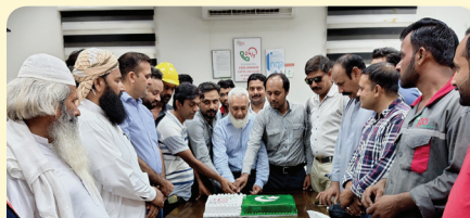
Independence Day - Sahiwal Depot