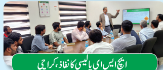
ایچ ایس ای پالیسی کا نفاذ، کراچی