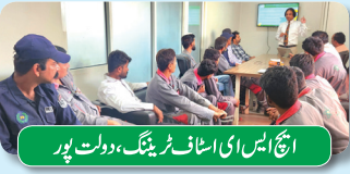
ایچ ایس ای اسٹاف ٹریننگ، دولت پور