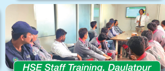
HSE Staff Training, Daulatpur