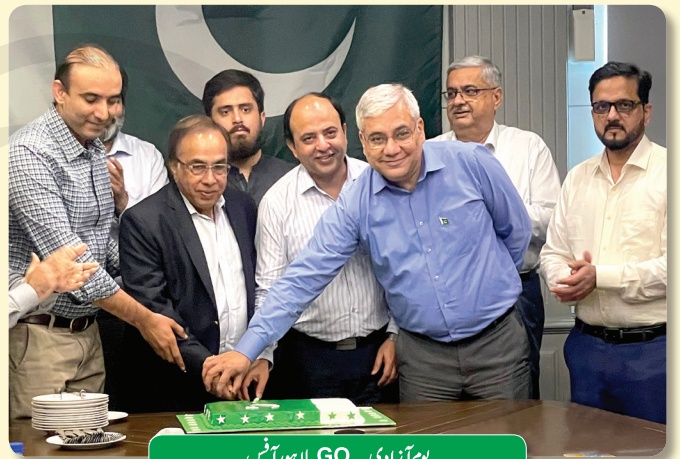
یوم آزادی - GO لاہور آفس

پاکستان کے یوم آزادی کا جشن کراچی اور لاہور میں GO کے کارپوریٹ اور ریجنل دفاتر میں قومی جوش و جذبہ کے ساتھ منایا گیا۔ GO کے ڈپوز اور ٹرینٹلز میں بھی یوم آزادی کے حوالے سے تقریبات منعقد کی گئی ہیں جن میں GO کے تمام ملازمین نے انتہائی جوش و خروش سے حصہ لیا۔ GO کے تمام پیٹروئل پمپس کو قومی رنگوں، سبز ہلالی پرچموں اور سبز اور سفید غباروں سے سجایا گیا تھا۔