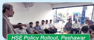
HSE Policy Rollout, Peshawar