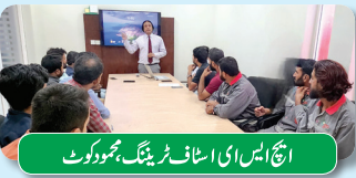
ایچ ایس ای اسٹاف ٹریننگ، محمود کوٹ