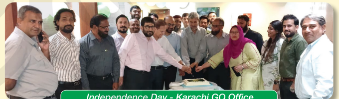
Independence Day - Karachi GO Office

The Independence Day of Pakistan was celebrated with great zeal and fervor at the GO Corporate and Regional Office in Lahore and Karachi, respectively. Similar ceremonies were held at GO depots and terminals, enthusiastically attended by GO employees. All GO locations were decorated in the National colours, the National flag fluttered as green and white balloons added a distinct flavor to the festivities.