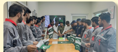
Independence Day - Kotla Jam Depot