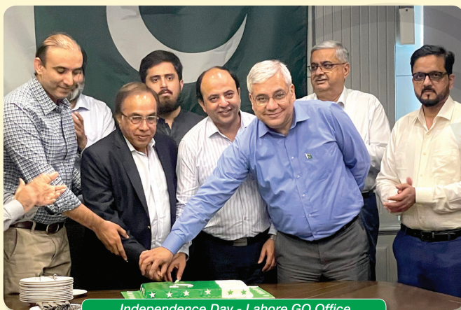
Independence Day - Lahore GO Office

The Independence Day of Pakistan was celebrated with great zeal and fervor at the GO Corporate and Regional Office in Lahore and Karachi, respectively. Similar ceremonies were held at GO depots and terminals, enthusiastically attended by GO employees. All GO locations were decorated in the National colours, the National flag fluttered as green and white balloons added a distinct flavor to the festivities.