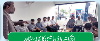
ایچ ایس ای پالیسی کا نفاذ، پشاور