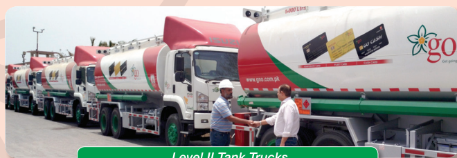
Level II Tank Trucks

tank trucks. Their support has been instrumental in achieving this milestone.