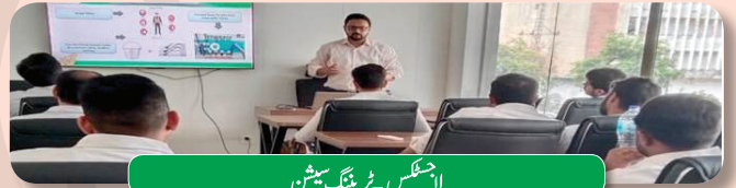
لاجسٹکس ٹریننگ سیشن

آئل ٹرانسپورٹیشن کی سپلائی چین میں پروڈکٹس کی محفوظ منتقلی اہم ترین جزو ہے، اس کے ساتھ ساتھ معیار اور مقدار کا خیال رکھنا بھی نہایت ضروری ہے۔ ریٹیل آؤٹ لیٹس پر پروڈکٹ کی ڈیلیوری