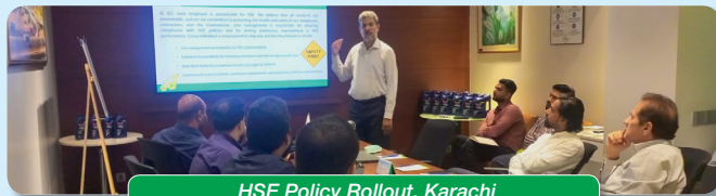
HSE Policy Rollout, Karachi

Safety Training sessions were conducted at Mahmoodkot Terminal and Daulatpur Depot. These safety training sessions were attended by Operations, Logistics, QA and Security teams of the respective locations.