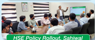
HSE Policy Rollout, Sahiwal