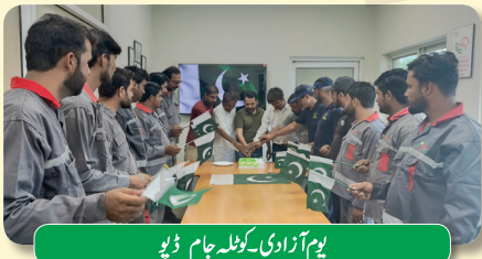
یوم آزادی - کوئٹہ جام ڈپو