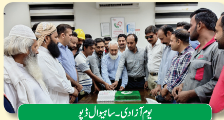
یوم آزادی - ساہیوال ڈپو