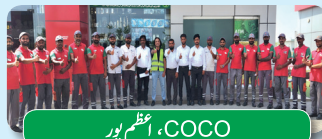
COCO، اعظم پور

ملتان اور کھرہ بھنجر کے زون نیچرز کیلئے ایچ ایس ای تربیتی سیشن منعقد کئے گئے جس کے دوران محفوظ سٹورز پر فوری طور پر عمل کی تربیت، COCO اور DOD اور ریٹیل آؤٹ لیٹس سے متعلق ایچ ایس ای پالیسیوں اور ایس او بیز کی اہمیت کی وضاحت پر توجہ مرکوز کی گئی۔ پالیسیوں اور طریقوں پر عمل درآمد کو یقینی بنانے میں زون نیچرز کے اہم کردار کو بھی اجاگر کیا گیا۔