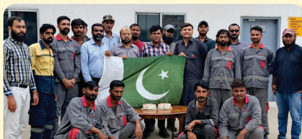
Independence Day - Port Qasim, Karachi